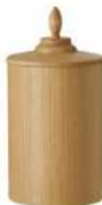
Ljus Ekfaner +895:-