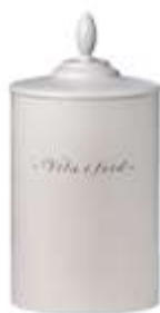
Allmoge grå +895:-