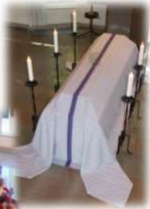
Ljuslila bårtäcket Eskilstuna församling