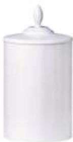
Vit lasyr +795:-