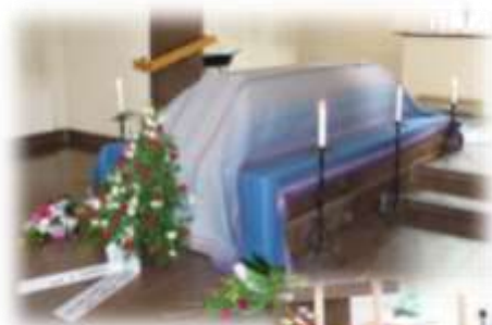
Torshälla församlings bårtäcke

Bårtäcke eller inte? Av etiska skäl måste man ha en kista. I vårt grundpris ingår en obehandlad kista. Till denna använder många ett bårtäcke vilket man kan låna utan extra kostnad. Svenska kyrkan tillhandahåller bårtäcken för sina medlemmar. Du får då låna det bårtäcke som finns i den församling den avlidne tillhör. Tillhör den avlidne en annan församling än den där begravningen sker kan det kosta att hyra bårtäcket. På bårtäcken får man inte lägga blomsterarrangemang, eftersom de inte går att tvätta. Handbuketter får man dock lägga på bårtäcket. Vill man ha blommor på kistan rekommenderas att man köper en behandlad kista (se nästa sida).